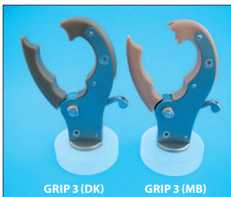
GRIP 3 (DK) GRIP 3 (MB)