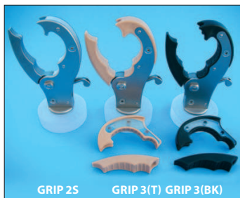
GRIP 2S GRIP 3(T) GRIP 3(BK)